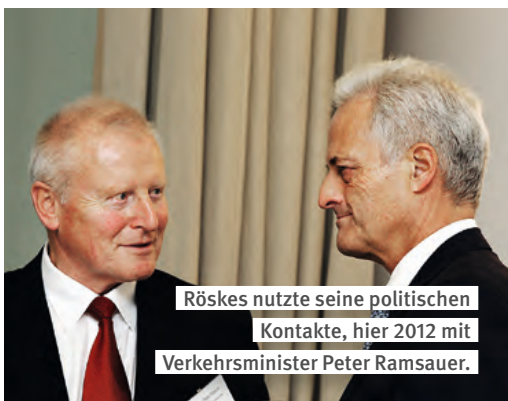
Röskes nutzte seine politischen Kontakte, hier 2012 mit Verkehrsminister Peter Ramsauer.