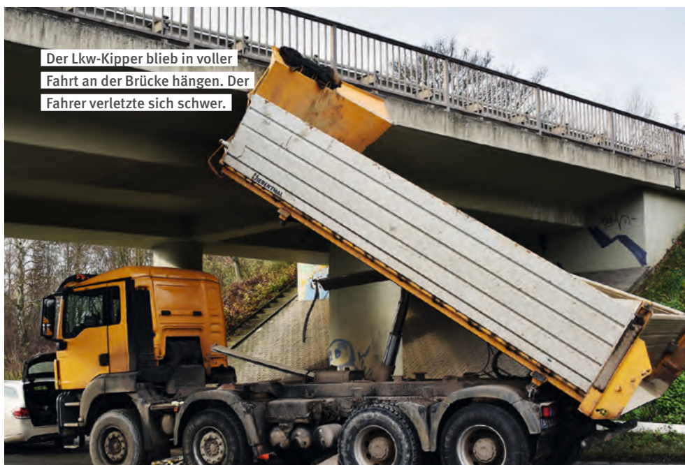
Der Lkw-Kipper blieb in voller Fahrt an der Brücke hängen. Der Fahrer verletzte sich schwer.

Leiter Kompetenzfeld Arbeitssicherheit bei der BG Verkehr