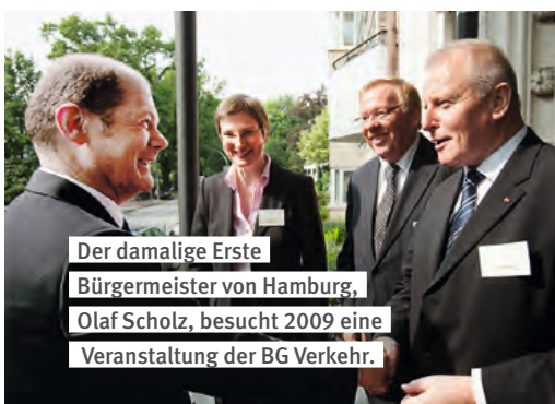
Der damalige Erste Bürgermeister von Hamburg, Olaf Scholz, besucht 2009 eine Veranstaltung der BG Verkehr.