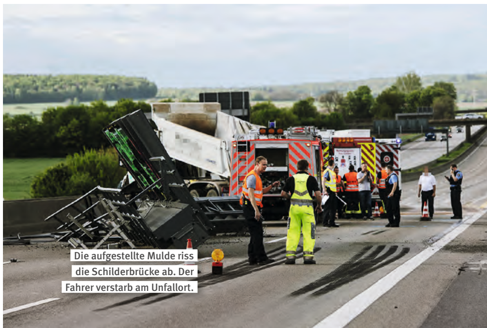
Die aufgestellte Mulde riss die Schilderbrücke ab. Der Fahrer verstarb am Unfallort.