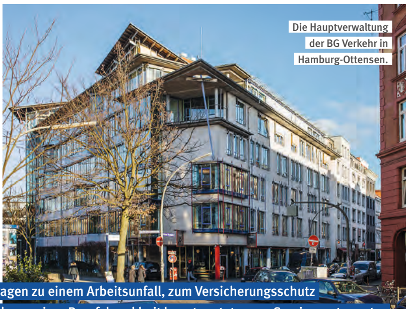
Die Hauptverwaltung der BG Verkehr in Hamburg-Ottensen.