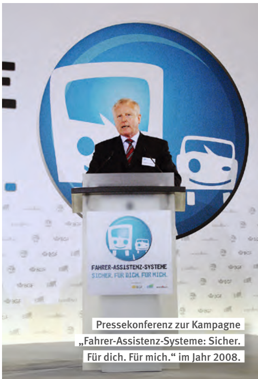
Pressekonferenz zur Kampagne „Fahrer-Assistenz-Systeme: Sicher. Für dich. Für mich.“ im Jahr 2008.