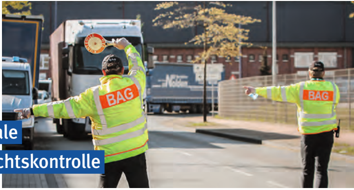
© Bundesamt für Logistik und Mobilität (BALM), Köln