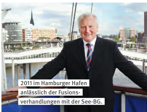
2011 im Hamburger Hafen anlässlich der Fusionsverhandlungen mit der See-BG.