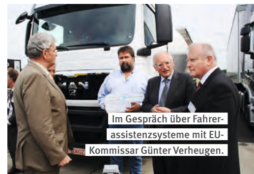
Im Gespräch über Fahrerassistenzsysteme mit EU-Kommissar Günter Verheugen.

Das kann ich Ihnen genau sagen: In den Verbänden kann man Forderungen aufstellen und diese dann auch beschließen. In der BG Verkehr sieht das etwas anders aus. Wir haben als Arbeitgeber nur 50 Prozent der Stimmen. Die anderen 50 Prozent hat die Arbeitnehmerseite. Wenn ich etwas erreichen möchte, muss ich die Vertreter und Vertreterinnen der Arbeitnehmer überzeugen und, falls nötig, einen Interessenausgleich finden. Das ist das Spannende: Man kann nicht einfach beschließen, sondern muss