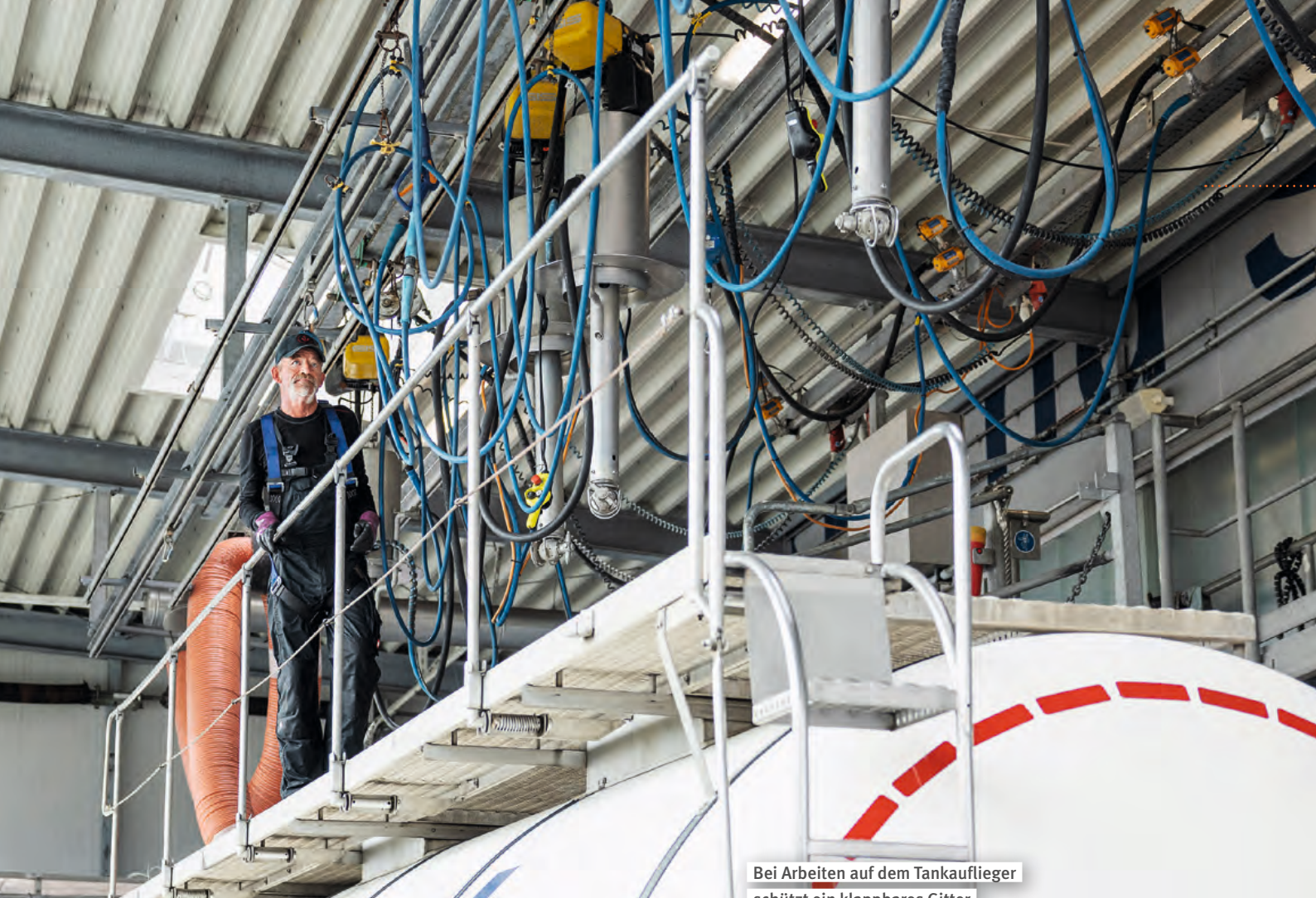
Bei Arbeiten auf dem Tankauflieger schützt ein klappbares Gitter zusätzlich vor dem Herabfallen.