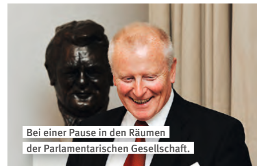
Bei einer Pause in den Räumen der Parlamentarischen Gesellschaft.