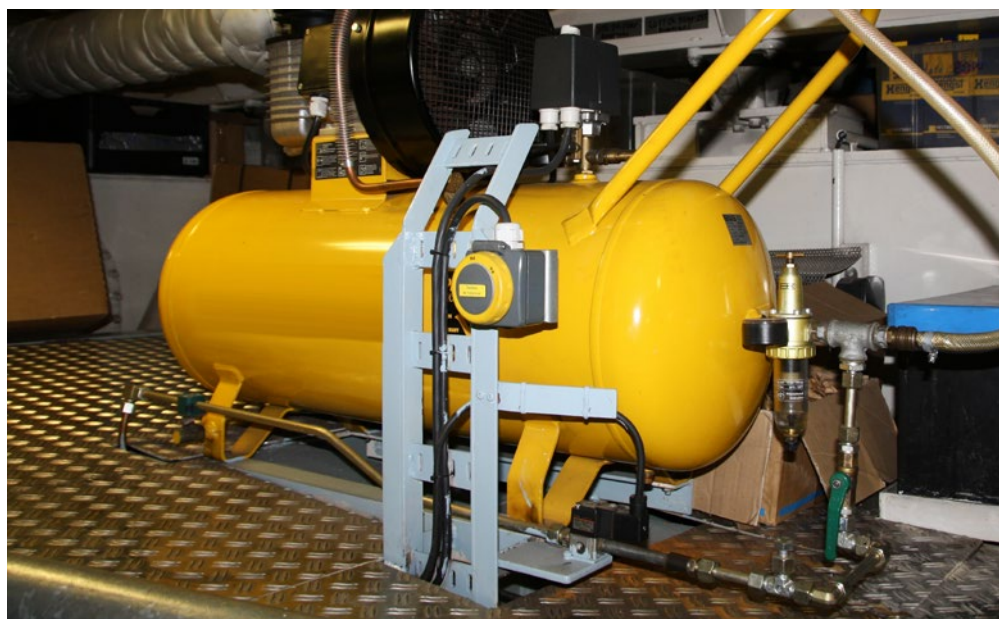
Abb. 1 Prüfungen sind Voraussetzung für den sicheren Betrieb

Für Fahrgastschiffe, die den Vorschriften einer anerkannten Klassifikationsgesellschaft entsprechen, sind in dieser Prüfinformation keine Detailprüfungen aufgeführt, die ausschließlich anlässlich einer Klassenbesichtigung durchgeführt werden müssen. Diese Prüfungen und deren Dokumentation werden von der Klassifikationsgesellschaft und nicht von Schiffseignerinnen und Schiffseignern veranlasst und verantwortet.