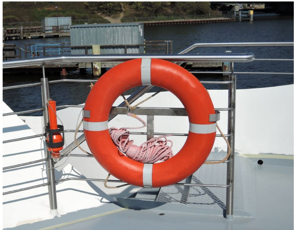
Abb.6 Selbst am Rettungsring gibt es viel zu prüfen.

Droht dem Unternehmer in einem solchen Fall die Inanspruchnahme auf Zahlung von Schadensersatz, ein strafrechtliches Ermittlungsverfahren oder ein behördliches Bußgeld, muss er nachweisen, dass er seinen Sorgfalts- bzw. Prüfpflichten nachgekommen ist. Zur eigenen Absicherung ist es daher unerlässlich, dass die durchgeführten Prüfungen und Angaben, die auch die ausreichende Qualifikation der Prüfenden belegen, entsprechend festgehalten werden.