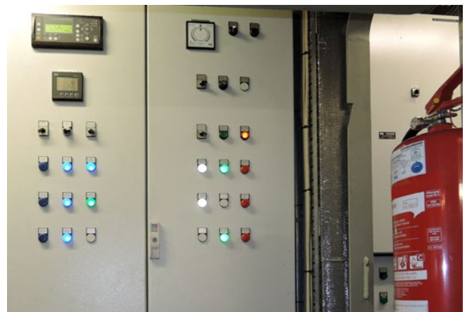
Abb.10 Elektroprüfungen sind nur mit Fachkompetenz möglich