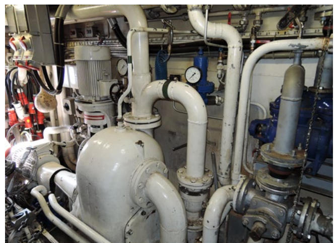
Abb. 3 Auch in der BinSchUO sind Prüfungen geregelt.