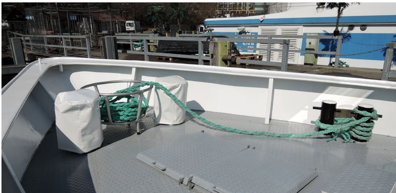
Abb.7 Das Tauwerk braucht eine regelmäßige Sichtprüfung