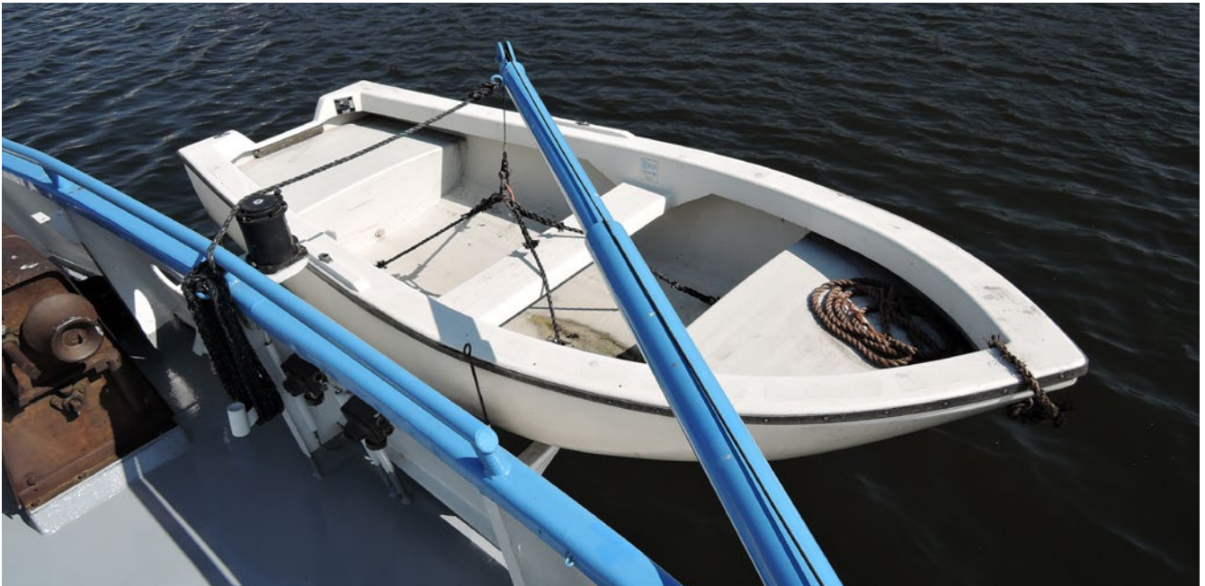
Abb. 4 Regelmäßig geprüft bringt es Sicherheit