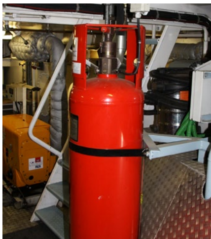
Abb. 5 Prüfungen sind auch eine Frage der Verantwortung

Unternehmer haben nicht nur die ethische Verpflichtung, die Arbeit an Bord so zu gestalten und zu organisieren, dass Arbeitsunfälle vermieden werden. Das Unterlassen von Prüfungen der zur Benutzung bereitgestellten Arbeitsmittel oder überwachungsbedürftigen Anlagen (z. B. Druckluftbehälter) und der Dokumentation dieser Prüfungen kann empfindliche juristische Konsequenzen nach sich ziehen.