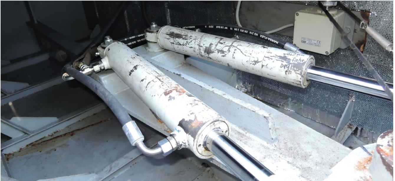
Abb.11 Prüfungen können Systemausfälle verhindern!

Nur ein Beispiel: Das stets und ständig verwendete Verlängerungskabel (siehe Anhang 4 Nr. 3.6 und 3.7), das unter allen Witterungsbedingungen zum Einsatz kommen soll, bedarf einer kurzfristigeren Prüfung, als eines, das nur gelegentlich in der Wohnung verwendet wird.