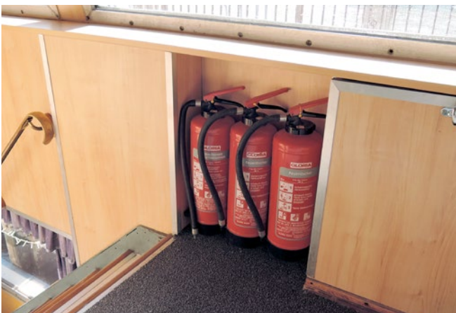
Abb.9 Die Feuerlöscher prüft der Sachkundige

Bei üblicher Nutzung des Objektes bietet es sich an, sich an den in den DGUV Vorschriften angegebenen Fristen zu orientieren. Bei sehr starker Nutzung eines Objektes müssen die Fristen verkürzt werden.