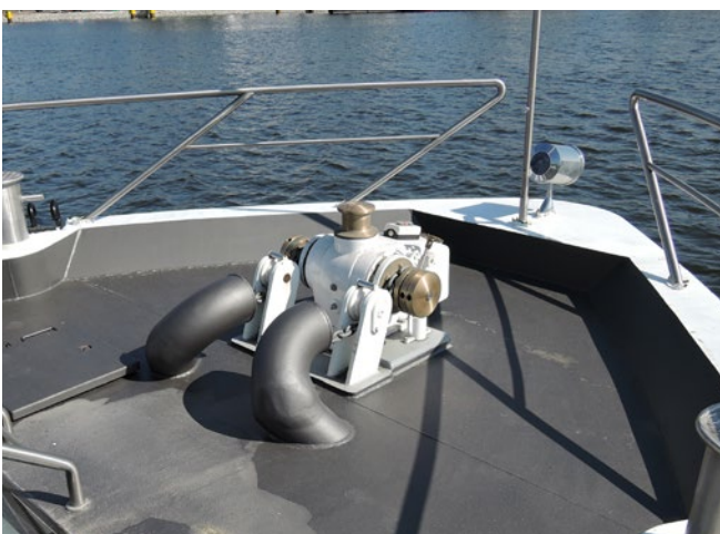
Abb. 2 Gerade Ankerwinden müssen geprüft sein

Alles, was bezüglich Bau und Ausrüstung in den staatlichen Vorschriften über die Verkehrszulassung (z. B. Binnenschiffsuntersuchungsordnung – siehe Abschnitt 2.1.3) gefordert wird, ist Teil des Fahrgastschiffes und wird nicht durch das Produktsicherheitsgesetz, sondern durch die in den Abschnitten 2.1.3 und 2.1.4 genannten Vorschriften geregelt.