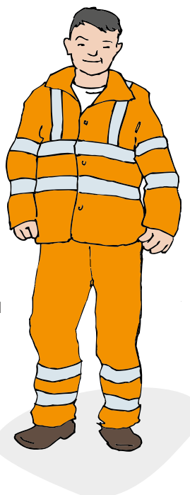
DIN EN ISO 20471 Klasse 3